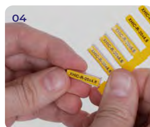
Отделите и установите держатель на проводник