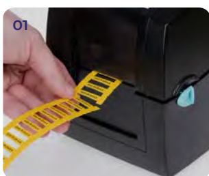
Распечатайте и отделите значения от общей ленты